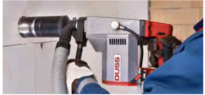
Dozen boren droog in kalkzandsteen met stofafzuiging