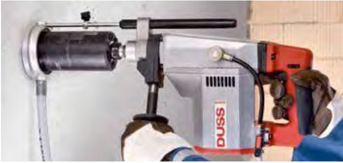
Dozen boren nat in beton met waterafzuiging