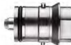
MACHINEADAPTER voor snelwisselsysteem BESTELNR. SVM