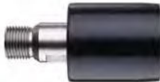
KROONADAPTER voor snelwisselsysteem BESTELNR. SVK

Met het DUSS SNELWISSELSYSTEEM kunnen gereedschappen binnen enkele seconden worden vervangen en boorkronen snel en eenvoudig worden verwijderd. Gereedschappen opsteken, draaien, klaar. Geen extra gereedschap nodig. Het snelwisselsysteem bestaat uit een aan de diamantboormachine aan te brengen machineadapter en een aan het desbetreffende gereedschap aan te brengen kroon-, gatzaag- resp. boorkoppenadapter. Het snelwisselsysteem kan worden gebruikt voor natboren en droogboren zonder softslag.