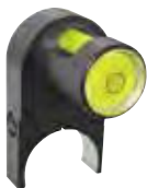
NIVELLEERHULP voor nauwkeurige uitlijning bij verticale en horizontale boringen BESTELNR. NH