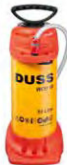
WATERDRUKTANK voor wateronafhankelijk boren, stalen reservoir, inhoud 10 l, slang 2,5 m weefsel versterkt en 1/2" koppeling met waterstop BESTELNR. WDB 10